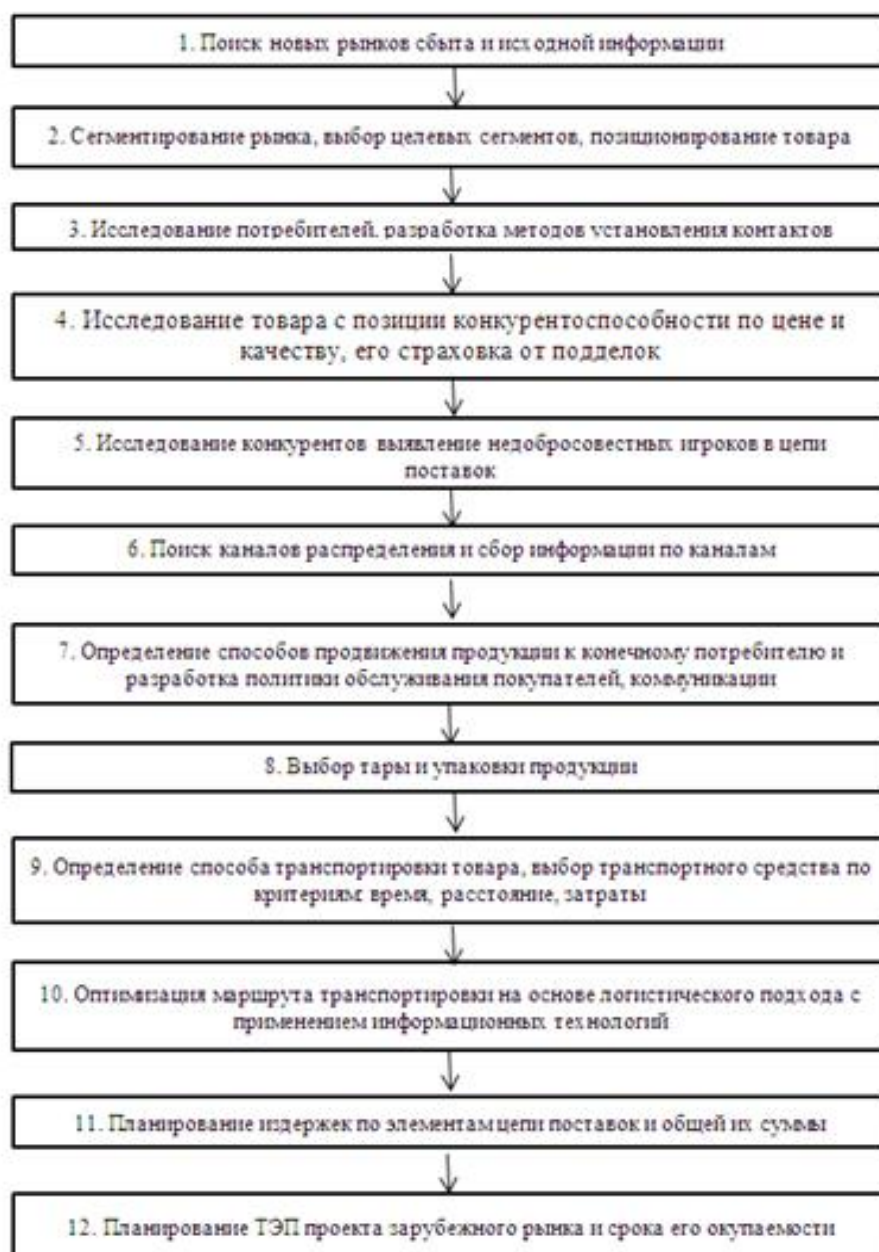
Рис.2. Алгоритм оболочки маркетинговой логистики выхода предприятия на зарубежные рынки сбыта

Во-первых, в функциональных звеньях логистики (физическое распределение, поддержка производства, снабжение) все ее компоненты должны быть интегрированы на основе общих затрат.