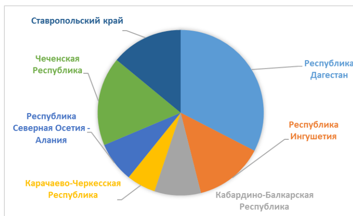
г) - Северо-Кавказский Федеральный округ