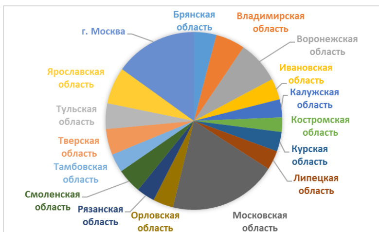
а) - Центральный Федеральный округ