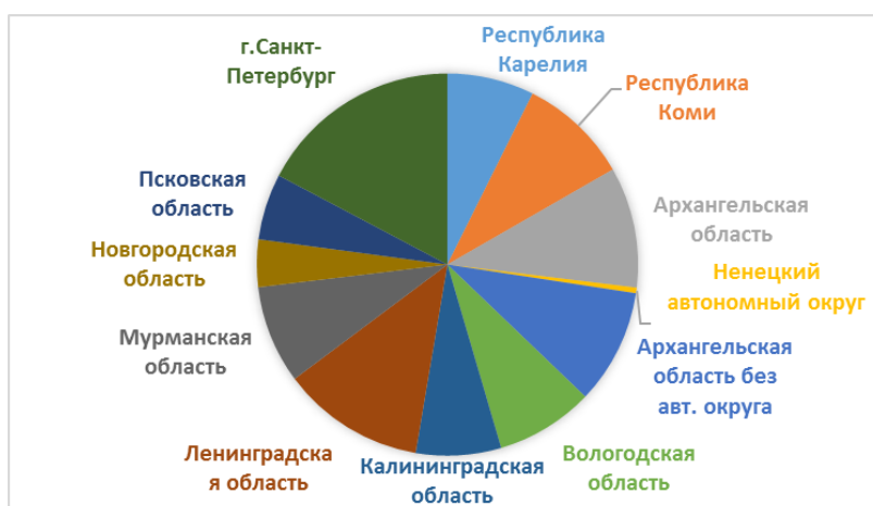
б) - Северо-Западный Федеральный округ